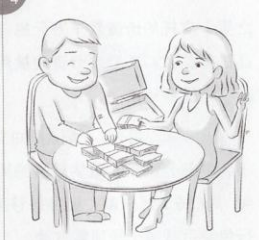
4 为避免公安机关追缴毒资，杨B以本人名义将毒资借给他人。