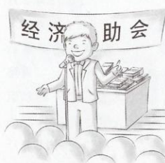
1 张某以“经济互助会”为幌子，非法吸收存款4000多万元。