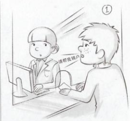
2 陈某将毒资转移后，立即将该账户销户。