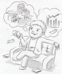
3 叶某代张某购买别墅和委托他人炒股。