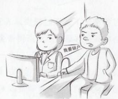
4 案发后，为了逃避追查，叶某将该账户销户。