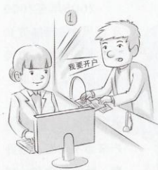
1 陈某到某银行新开一账户，当日接收毒资45万元。